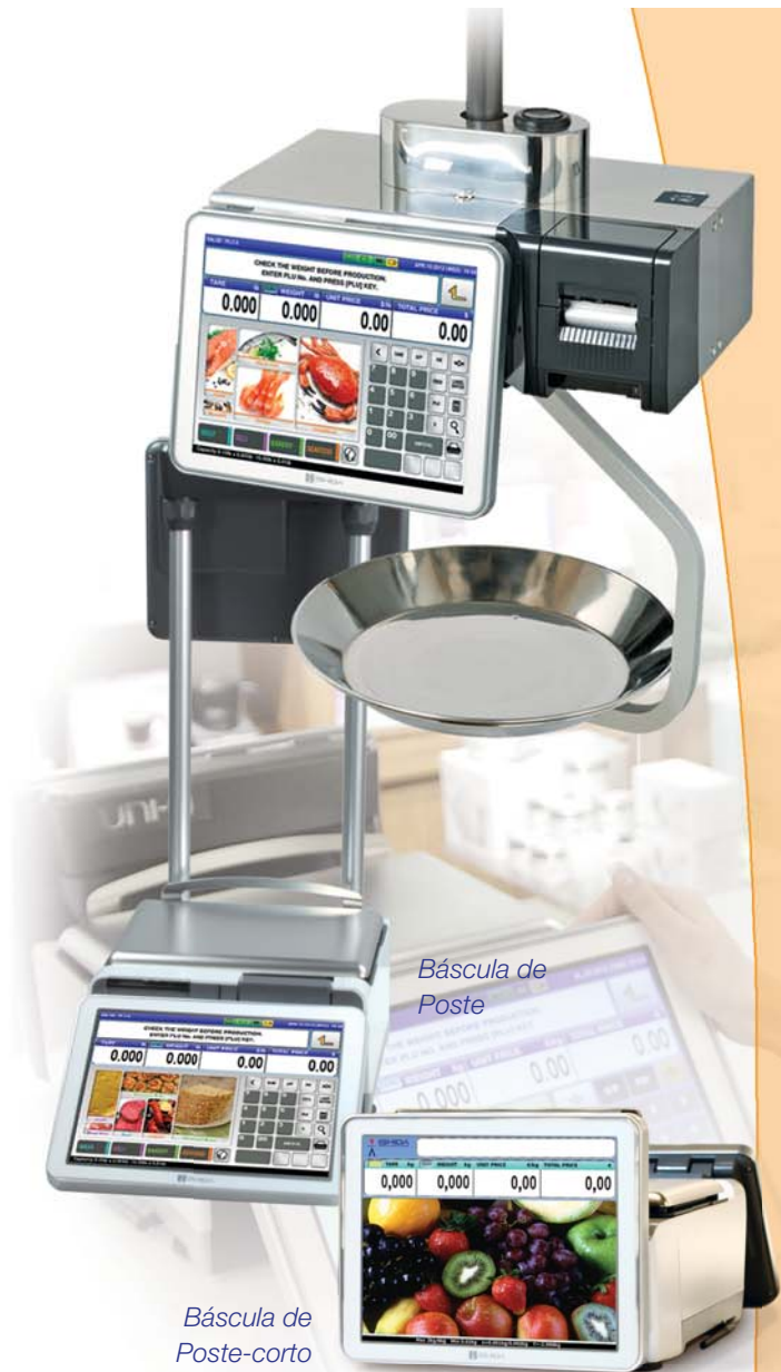
Báscula de Poste