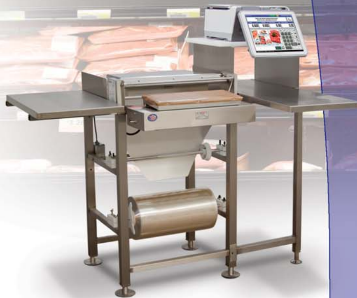
Uni-9 RP con componentes opcionales de empleye

La Uni-7 RP ofrece flexibilidad y funcionalidad. La Uni-7 RP con base de báscula remota es el modelo perfecto para integrarse con estaciones manuales de empleye. Al presionar la pantalla o un botón el trabajador obtendrá una sensación táctil y un sonido. El cartucho de etiquetas de carga frontal ahorra tiempo y espacio. La Uni-7 RP se puede comunicar con PCs via Ethernet or Wi-Fi.