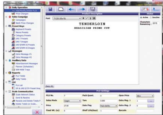
Pantalla de edición PLU