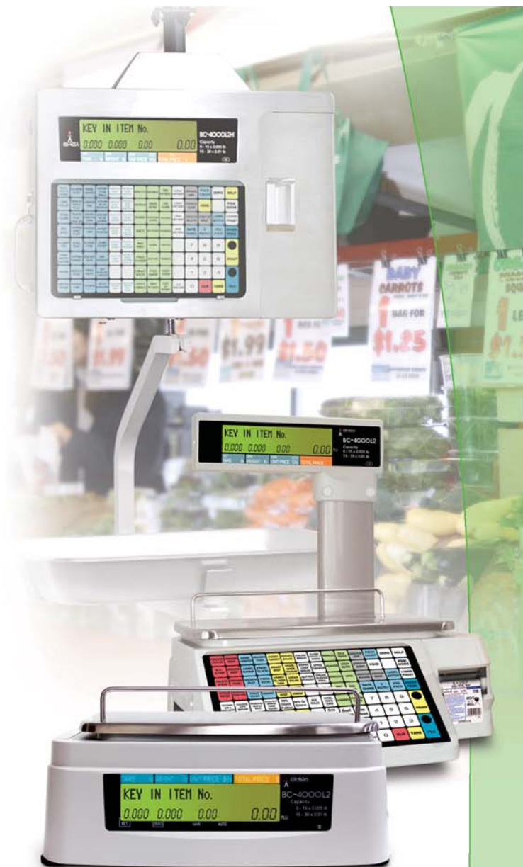
Vista del cliente de la báscula de mesa