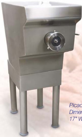
Picadora TX-22 en base opcional. Dimensiones totales: 45" H x 28.25" D x 17" W

Perfectas para delis, carnicerías pequeñas, cafeterías y más, la TX-22 para mostrador está hecha enteramente por acero inoxidable 304. Desde el cárter y la cabeza cortadora hasta el tornillo alimentador, todas las partes de acero inoxidable proveen la mejor molida por más tiempo. Su cárter de una sola pieza y motor 1-hp están diseñados para funcionar durante trabajos largos sin sobrecalentarse o atascarse. La construcción de acero inoxidable combinada con esquinas lisas, uniones selladas y fáciles de quitar facilitan su limpieza.