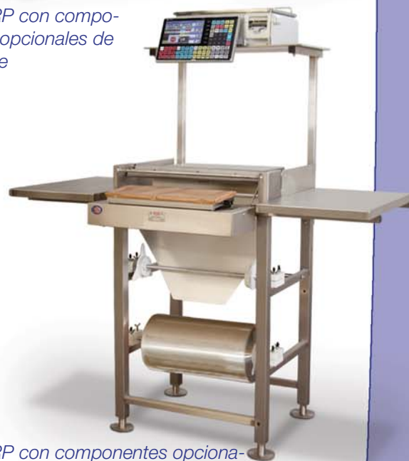
Uni-7 RP con componentes opcionales de empleye