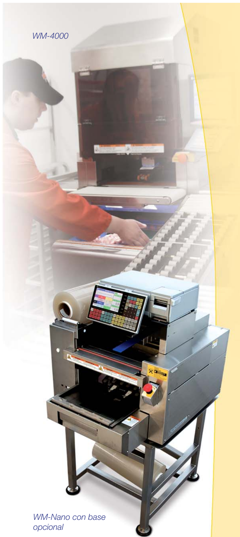
WM-Nano con base opcional