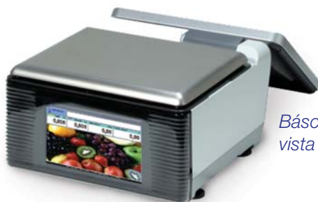
Báscula de Mesa vista del cliente

La báscula de mesa Uni-9 está disponible con o sin una pantalla de 7-pulgadas para el cliente y es ideal también para la trastienda, producción y operación de mostrador. La Uni-9 ofrece operación inalámbrica.